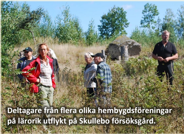
Deltagare från flera olika hembygdsföreningar på lärarik utflykt på Skullebo försöksgård.

Vi fick lära oss en hel del om skogsbruk genom tiderna och hur det ser ut idag. Den äldre skogen som vi oftast tycker ger den rätta skogskänslan, är just den som bedöms som avverkningsmogen.