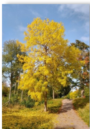
Brunnby slussar, Göta kanal, Vreta kloster.