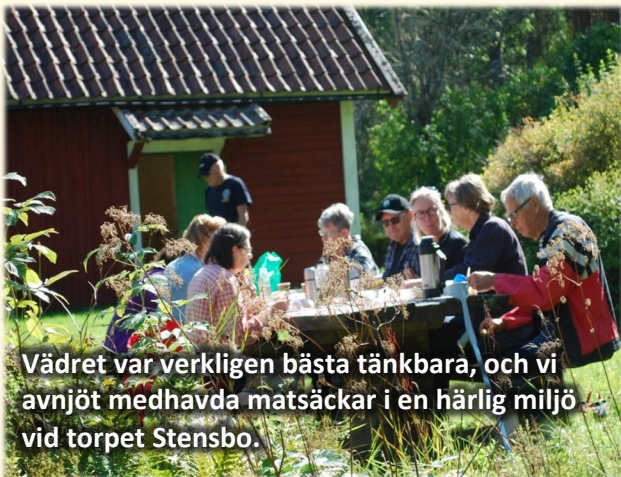
Vädret var verkligen bästa tänkbara, och vi avnjöt medhavda matsäckar i en härlig miljö vid torpet Stensbo.

G enomsnittsåldern på en skog idag är 105 år, men det håller på att förkortas ned mot 60–80 år, vilket ger kortare tid för den rätta skogskänslan. Hälften av all skogsmark ägs dock av privatpersoner, och det finns därmed ett varierat skogsbruk som styrs av annat än bara ekonomi, såsom skogsägarens livssituation och intressen. Det mesta av dagen ägnades åt att ta oss runt ute, till olika delar av skogen och se exempel på skötsel och mycket annat. Många tankar väcktes. Hur har vi det med skogskänslan här? Vad tänker man sig för kommande skötselåtgärder här?