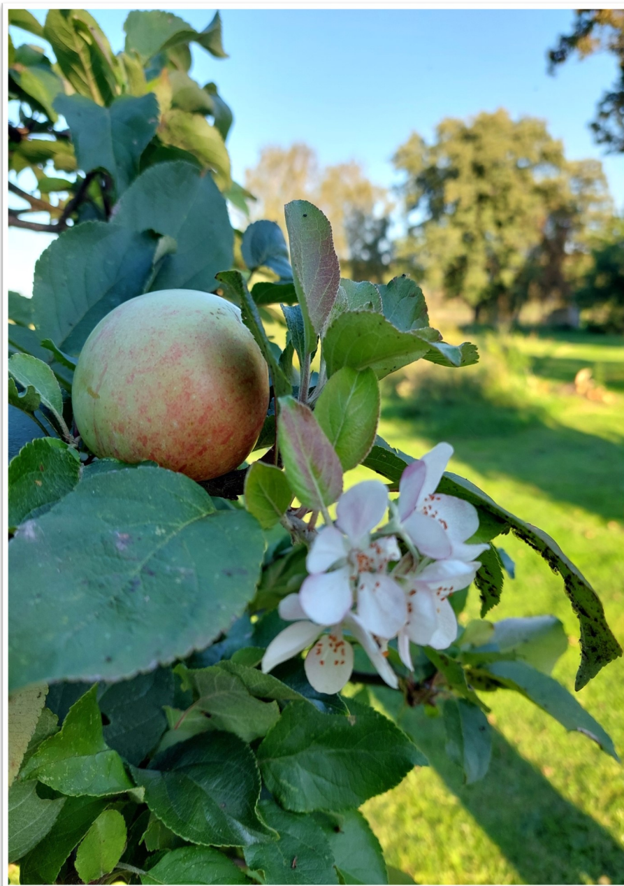
Äppelträd vid Härna Åland, Vreta kloster.