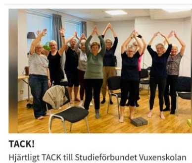
TACK! Hjärtligt TACK till Studieförbundet Vuxenskolan